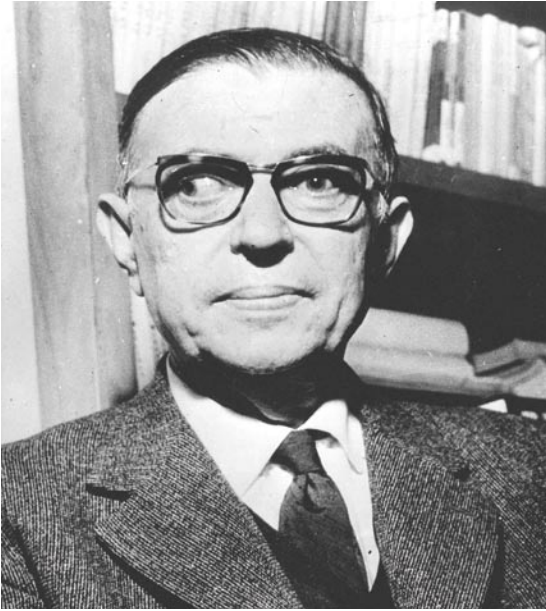
Jean-Paul Sartre over de breuk met Merleau-Ponty: 'Hij heeft mij nooit verloren en door zijn dood moest ik hem verliezen'

stelling van een arm, maar de ambivalente aanwezigheid van een arm. De patiënt blijft op zijn arm rekenen, ook al is die niet meer fysiek aanwezig. Het fenomeen van een fantoomarm wijst op de dubbele verhouding die we tot ons lichaam hebben. We ervaren het zowel van buiten als van binnen. Merleau-Ponty wijst erop dat die ambiguïteit er altijd zal blijven. Deze ambiguïteit stelt grenzen aan de maakbaarheid van het lichaam. Je kunt je lichaam als object behandelen en een nieuwe hand krijgen. Maar deze nieuwe hand zal deel moeten worden van je habituele lichaam. De ervaring moet weer in overeenstemming gebracht worden met de feitelijke toestand van je lichaam. Dat dit niet vanzelfsprekend is, blijkt wanneer iemand zijn prothesehand weer laat verwijderen omdat hij er niet aan kan wennen. Volgens Merleau-Ponty is die persoon niet in staat zijn om zijn ervaring van zijn habituele lichaam in overeenstemming te brengen met zijn actuele lichaam. Merleau-Ponty laat ons stilstaan bij dat wij niet alleen een visuele ervaring van ons lichaam hebben. Wij ervaren ons lichaam ook van binnenuit, en ontwikkelen in ons handelen en door gewoontevorming een bepaalde stijl. Die dubbele ervaring van ons lichaam maakt het mogelijk om nu eens naar ons lichaam te kijken als een object, en het dan weer van binnenuit te ervaren.